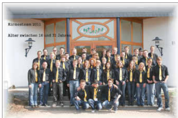
Nach einer Pause von 2 Jahren wieder Weizenkirmes in Istha vom 26. - 28. Mai 2022.