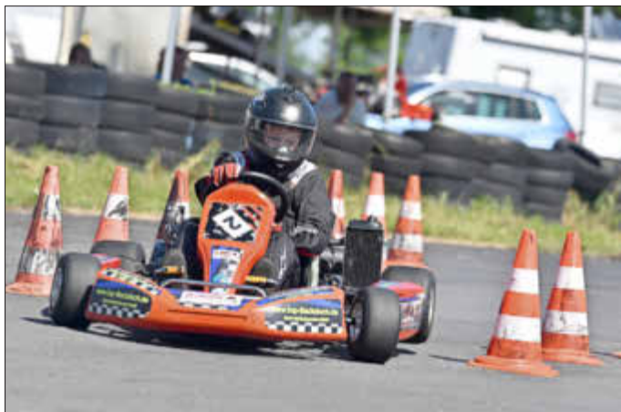
Geschicklingkeitsparcours im Wettbewerb ADAC Kart-Slalom 2000

Infostand des MSC auf dem Johannifest am 15. Mai