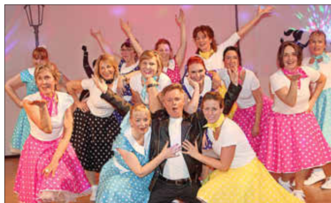
Die „TSV-Nacht des Sports“ naht ... Samstag, 18. Juni: Seid dabei!