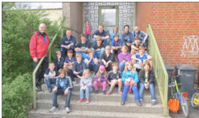
Die Jugendarbeit im Tischtennis ist eine der wichtigsten Säulen beim TSV, hier ein Bild aus 2013.

Das Wetter ist perfekt um das Fahrrad aus der Garage zu holen, die Schrauben nachzuziehen, den Luftdruck zu kontrollieren und bereits ein leichtes Training zu absolvieren. Denn am Samstag, 04. Juni startet die TSV-Radtour. Seid dabei!