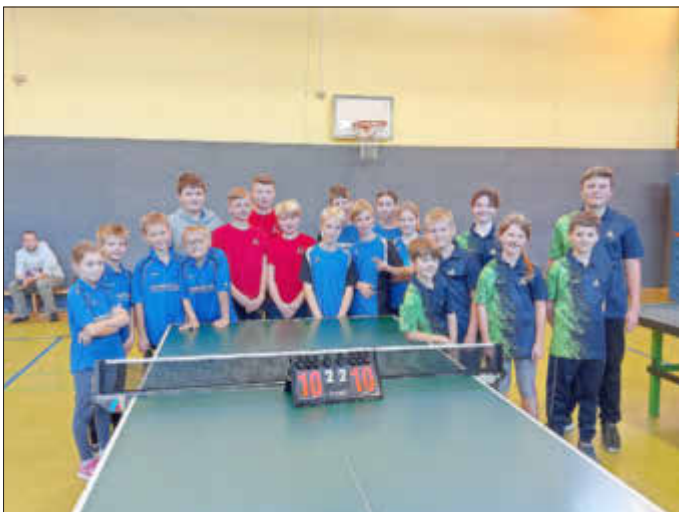
Aktiver TT-Nachwuchs: Serienspieltag in Wenigenhasungen zusammen mit Naumburg, Sielen und Hümme.