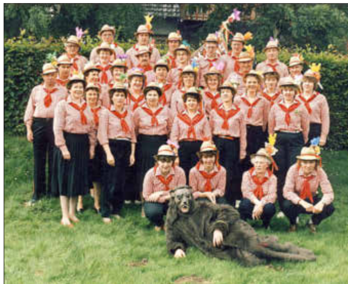
Der ehemalige Gesangverein oder auch gemischter Chor aus Istha damals Ausrichter der Kirmes