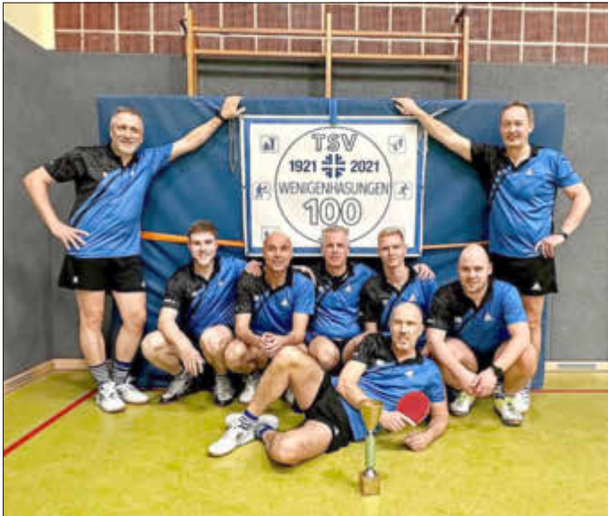
Die Erste vom TSV ist weiterhin Tabellenführer der Bezirksliga