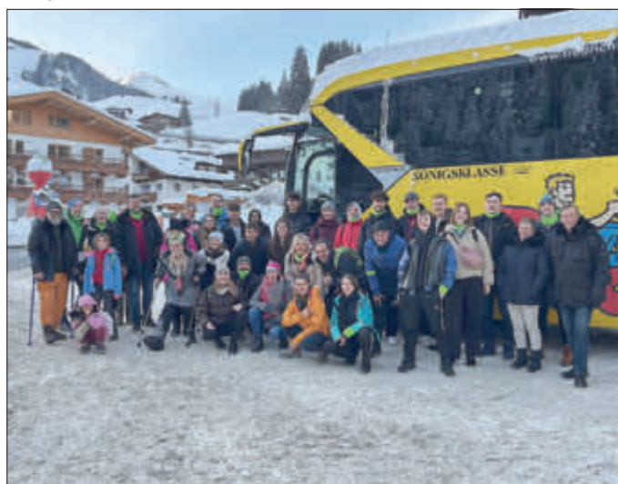
Traumhaftes Panorama vom Tuxer Gletscher - Die Gruppe kurz vor der Rückfahrt von Vorderlanersbach

Am 24./25.8.2024 fahren wir mit Roger Neusel zur Sandkerwa nach Bamberg. Es gibt nur noch sehr wenige freie Plätze. Wer bei dieser Tour dabei sein möchte, kann sich gerne an Matthias Pflüger für weitere Informationen wenden.