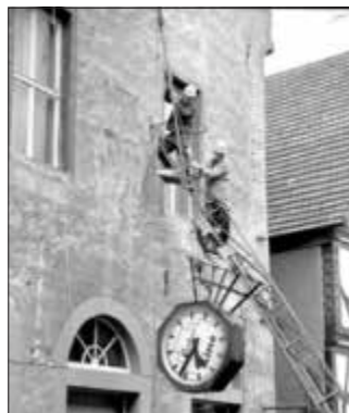
Abbau der Uhr an der Steinkammer, Schützeberger Str. 37 (Central-Kino) am Ende der 60er-Jahre

Wie schon im vergangenen Jahr, sollen an den Vorfahrtstagen noch nicht im letzten Jahr gezeigte, alte und neuere Filme über Wolfhager Ereignisse über die Leinwand gehen. Hierbei gelang es dem Autor Dirk Lindemann Filme aus den Fünfziger-Jahren bis zur Jahrtausendwende zu einem informierenden und unterhaltsamen Film zusammenzustellen.